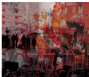
For You My Son