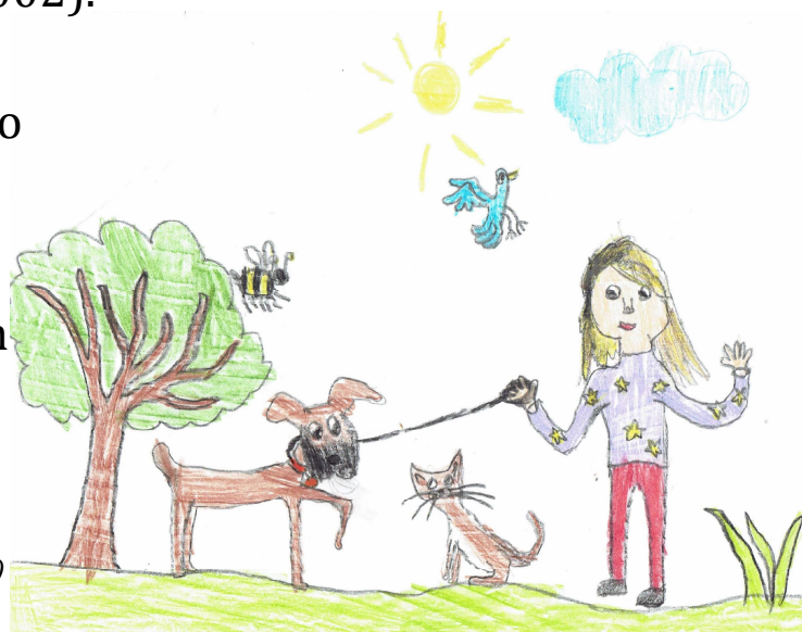
Na obrázku od respondentky Amálie (8 let) je její sestra venčící fenku Abigail

Antropomorfní myšlení dovoluje lidem začlenit psy do jejich sociálního prostředí. Bez přesvědčení, že si psi užívají naši společnost, nebo nás postrádají, když jsme pryč, či si se k nám chovají loajálně, ztrácí náš vztah se psy mnoho ze své hodnoty. (Boni 2008).