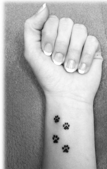
Tetovaná ruka dcery respondentky Venduly