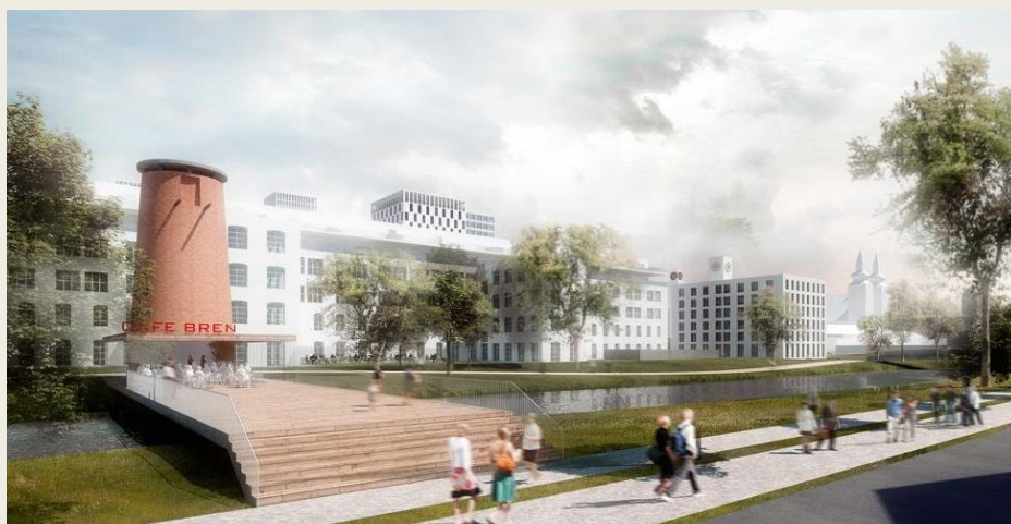
Architektonický plán Novej Zbrojovky