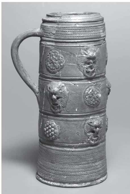
OBR. 4: Pražský hrad, Vikářská ulice čp. 37/IV, kameninová holba — inv. č. 43.