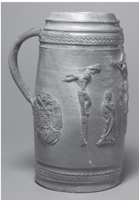
OBR. 5: Pražský hrad, Vikářská ulice čp. 37/IV, kameninová holba — inv. č. 41.

Datování nálezů z odpadní jímky ve Vikářské ulici čp. 37/IV se opírá o přesně datovaný předmět — pohár s letopočtem 1595 a rozbor keramiky, která pochází z přelomu 16. a 17. století.