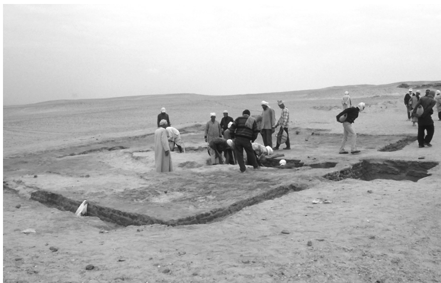
Obr. 2 Nově odkrytá cihlová hrobka (R 3) - pohled od jihovýchodu