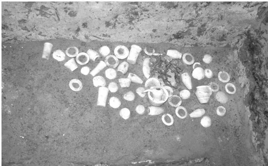
Obr. 3 Zbytky pohřební výbavy - miniaturní vázičky z alabastru.