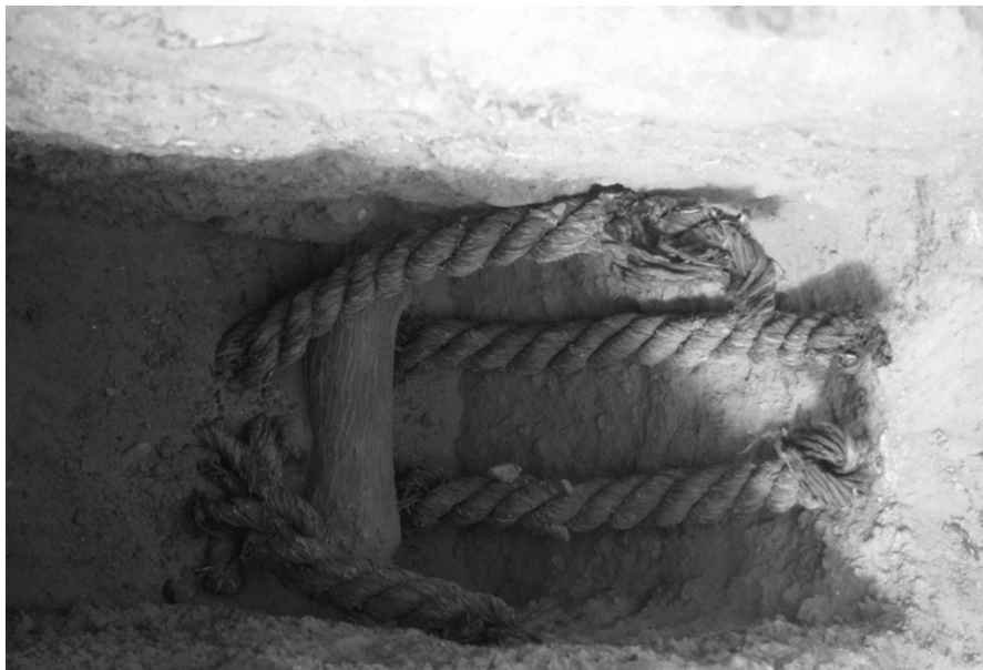
Obr. 1 Zbytky lan u západní šachty Iufaovy hrobky.