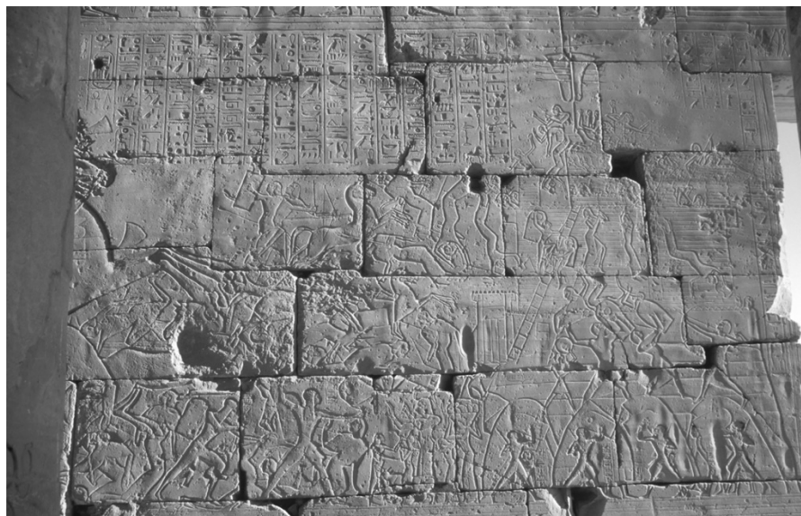
Obr. 2 Bitva u Kadeše, reliéf z Ramessea.