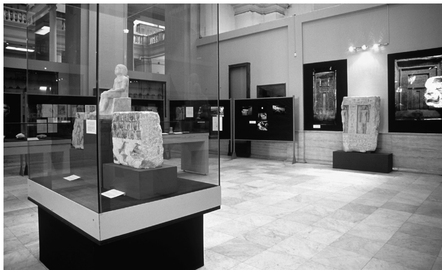
VLČKOVÁ – Obr. 1 Instalace výstavy „Osudy staré 4500 let“.