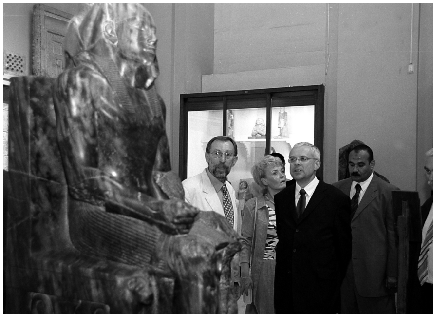
Vlčková - Obr. 3 Profesor Verner provádí premiéra ČR Špidlu po káhirském Egyptském muzeu (socha panovníka 4. dynastie Rachefa).