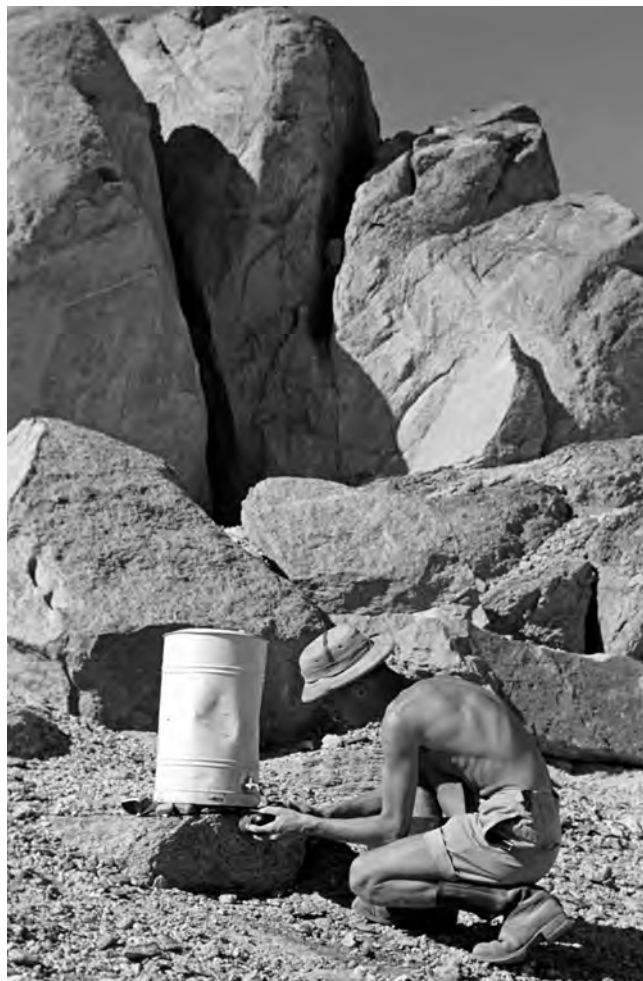
Obr. 5 Jaromír Málek u zásobnice s pitnou vodou během zastávky v poušti

Písemné prameny k první expedici do Núbie jsou klíčové pro poznání zázemí a materiální připravenosti československých egyptologů. Než se mohli vydat do vzdálené a poměrně těžko dostupné Núbie a začít svou vědeckou činnost v terénu, bylo třeba vykonat mnoho práce. Výprava uskutečněná v roce 1961 již měla připravené zázemí v Káhiře, ale její hlavní úkol měl těžiště mimo lidské osídlení (Núbijci již své vesnice a města opouštěli). Bylo nutné vytvořit přijatelné zázemí pro velmi mobilní expedici, a tak bylo rozhodnuto opatřit za tímto účelem vlastní plavidlo. Pobyt v Egyptě a v Núbii zahrnoval několik měsíců, od dubna do prosince, a na tuto dobu bylo potřeba sehnat odpovídající vybavení od lodních součástí a lodního příslušenství (lana, skládací lůžka, vařiče, lednice atd.) přes přístroje, oblečení a séra proti uštknutí jedovatými hady a štíry po trvanlivé potraviny, které byly dů-