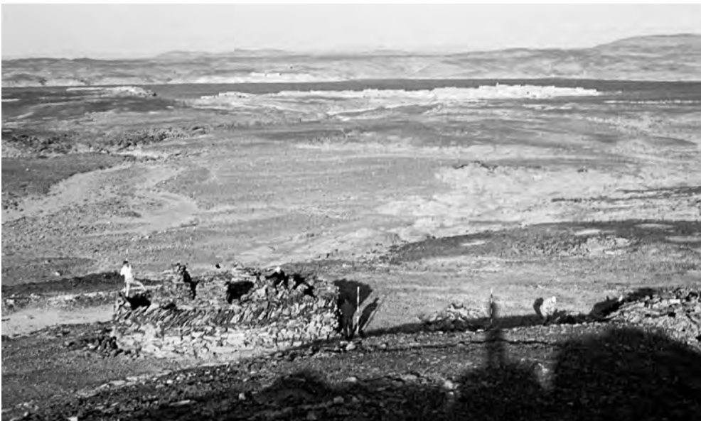
Obr. 7 Výzkum lokality Wádí Kitna v roce 1965

Dobová dokumentace obsahuje mnoho podrobností, které se týkají přípravy lodi a jejího vybavení, náčrty plavidla a další detaily. Nejintenzivnější stavební práce probíhaly v prosinci 1960 a lednu 1961. Materiál (součásti trupu, trubkový materiál, plachty pro krytí ubikací, ale také lodní lampy, prkna na paluby, kormidelní zařízení, kotvy) bylo nutno objednávat, zařizovat dodání, dohlížet na montáž atd. Konstatování „Vzhledem k tomu, že veškeré řemeslné práce jsou zadávány socialistickému sektoru (jak jinak není možné) a každé pracoviště má nyní vlastní maximální plán – je nutné věnovat nákupům či obstarání úzkoprofilového materiálu a prosazením provedení neplánovaných prací maximální úsilí...“ 27 hovoří za mnohé a mimo jiné dokládá, že i když státní moc rozvoji egyptologie v 60. letech díky úsilí profesora Žáby nebránila, rozhodně také nešlo o státem protežovaný či chráněný projekt. Velkou roli v jeho úspěšné realizaci sehrálo osobní nasazení členů Žabova týmu na různých úrovních a Žabova schopnost najít řešení – a to včetně využití některých aspektů dobové politické rétoriky, pokud to bylo nutné.