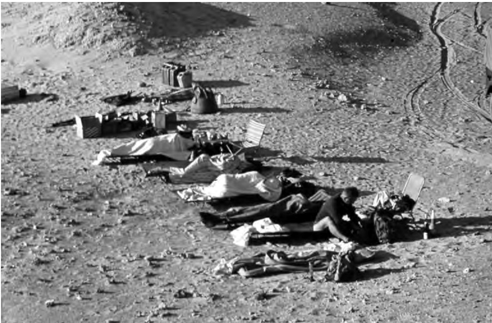
Obr. 6 Táboření ve Východní poušti při jednom z přesunů mezi Káhirou a Núbíí

ležité pro období pobytu expedice mimo kontakt s osídlenými oblastmi. 23