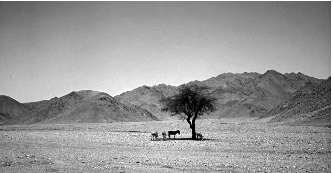
Obr. 1 Fauna a flóra ve Východní poušti