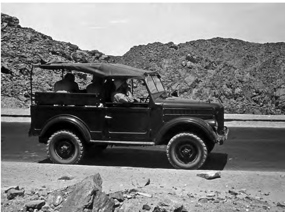
Obr. 4 Terénní vozidlo Čs. egyptologického ústavu