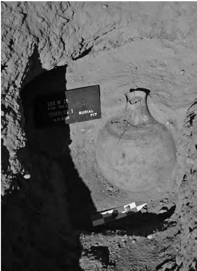
Obr. 5 Velká kulovitá nádoba, tzv. pivní džbán, umístěná na prahu pohřební niky

I když se jedná o pohřeb nepříliš bohatý, získané nálezy poskytují důležité informace. Kumulace uhlíků při okraji ústí rampy přímo nad pohřební komorou – patrně pozůstatek ohniště (zápalné oběti?) založeného před vybudováním kamenného jádra a navršením mohyly – představuje další doklad používání ohně v souvislosti s pohřebními – purifikačními či jinými – rituály v postmerojském období (viz též Lenoble 1987: 99; Caneva 1994: 85; Kołosowska – El-Tayeb 2007: 18, 26). Fajánsové korálky jsou významnou indicií kontaktů tohoto archeologicky zatím jen málo poznaného území s některým ze známých center produkce (a patrně též moci) tehdejší doby, v nichž je nutné předpokládat výrobu technologicky náročné fajánsy. Nelze vyloučit, že jde o starožitnosti uchovávané lučištníkem, příp. jeho společností, ještě nějaký čas po zániku samotného merojského impéria. Vazbu na někdejší výrobní a politická centra indikují též zbraně – šípy a oštěp/kopí s hroty ze železa – uložené u zemřelého. Výroba železa v merojské době podléhala královskému monopolu a byla mimo hlavní město říše, Meroe, soustředěna jen do několika málo městských (královských) center – rozsáhlé haldy strusky dokládají výrobu železa v merojské době například v Kawě, v Napátě, na ostrově Argo (Haaland 2006: 141) a v Hamadábu, lokalitě vzdálené jen 15 km od samotného Meroe, kde železářská výroba rozvinuvší se zde v pozdním merojském období pokračuje až hluboko do postmerojské doby (Humphris 2014; srov. též Baud 2010).