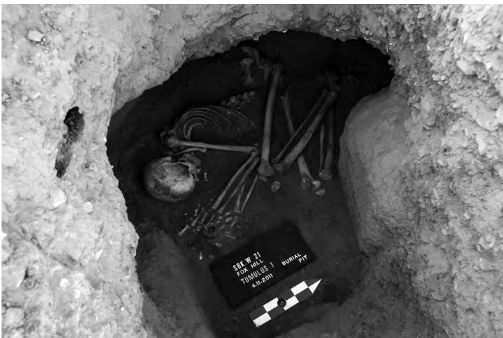
Obr. 3 Intaktní pohřeb s hrobovou výbavou typickou pro pohřby lučištníků postmerojského období. Na snímku již schází vyjmutý pivní džbán, který byl původně postaven před kolena zemřelého

V oblasti krku a horní části lučištníkova trupu bylo nepravidelně rozmístěno celkem 223 korálek nebo jejich fragmentů. Soubor zahrnoval: 191 trubičkovitých či soudkovitých korálek z modré fajánse, 7 kulovitých z bílé fajánse, 8 kulovitých z oranžovo-červeného křemene, 2 kulovité z bílého křemene a 15 úplných či fragmentárních