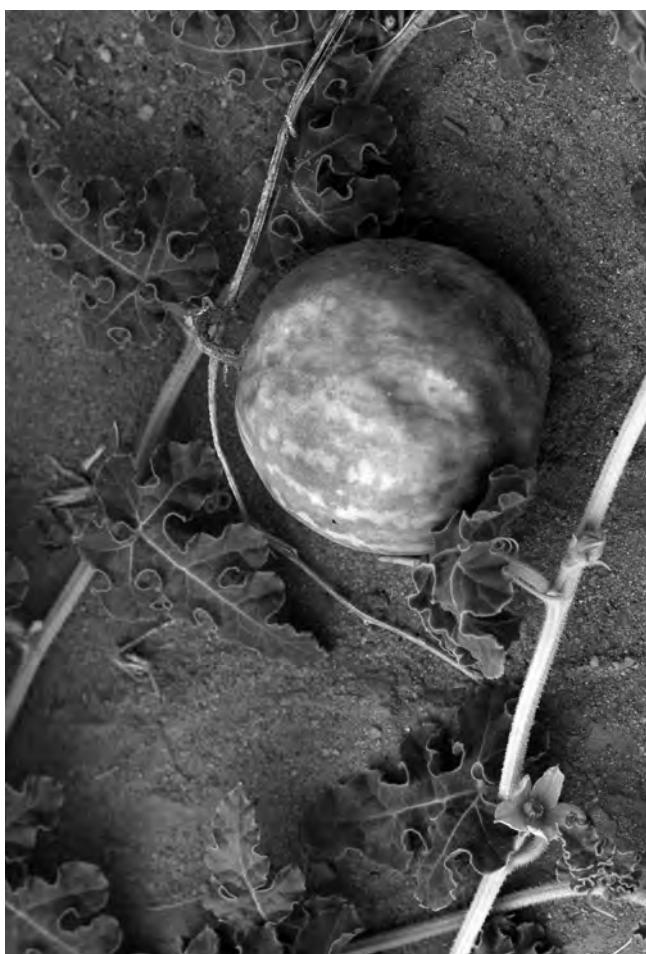
Obr. 4b Kolokvinta obecná ( Citrullus colocynthis ), liánovitá rostlina příbuzná melounu, která roste v pouštním a polopouštním písčitém prostředí. Hořké plody jsou požitelné pouze po tepelné úpravě. Na obrázku suchý plod, listy a květ, lokalita Musawwarát es-Sufra

diskovitých korálků ze skořápek pštrošího vejce (viz Suková et al. 2014: 182, obr. 76). Korálky mohly původně tvořit náhrdelník nebo pocházet z výšivky blíže nezjištěného oděvu. Mezi tyto ozdoby patřilo zřejmě také 8 provrtných semínek kolokvinty obecné (obr. 4a), hořkého pouštního „melounku“ Citrullus colocynthis (obr. 4b).