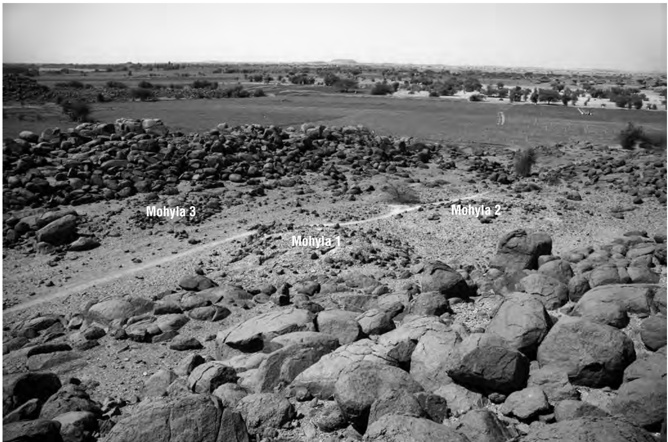
Obr. 1 Rozmístění mohyl č. 1–3 na jedné ze sídlištních teras Liščího kopce při jihozápadním okraji pohoří Sabaloka. Superstruktura Mohyly 1, vybrané k výzkumu (ve středu snímku), je narušena zlodějským vkopem