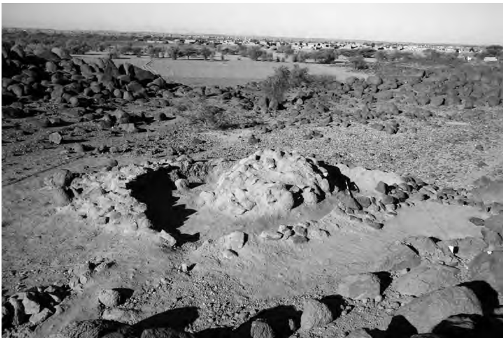
Obr. 2 Vnitřní kamenné polokulovité jádro a kamenný límec původně překrývající násyp mohyly, jež byly vytvořeny ze středně velkých kusů místní žuly

komora – či spíše větší nika – intaktní pohřeb muže (?) ve věku 35–50 let. Zemřelý jedinec byl do hrobu uložen ve skrčené poloze na pravém boku s hlavou k jihu a tváří otočenou k východu (tj. směrem ven z hrobu), s pažemi ohnutými v loktech a dlaněmi umístěnými před obličej (obr. 3). Několik předmětů uložených u zemřelého naznačuje, že se jednalo o lučištníka (viz Suková et al. 2014: 182–183, obr. 75, 77–79). Levou dlaní zesnulý překrýval čtyři silně korodované železné hroty šípů s charakteristickým jedním zpětným háčkem a nepatrnými, díky kontaktu s korozi dochovanými zbytky dřevěných ratišť (d. 4–5 cm) a listovitý železný hrot oštěpu nebo kopí (d. 9 cm, š. 2,30 cm). Tyto zbraně byly položeny podél nebožtíkova těla. U pravého palce zemřelého byl umístěn důkladně opracovaný kroužek kónického tvaru vyrobený ze zdob-