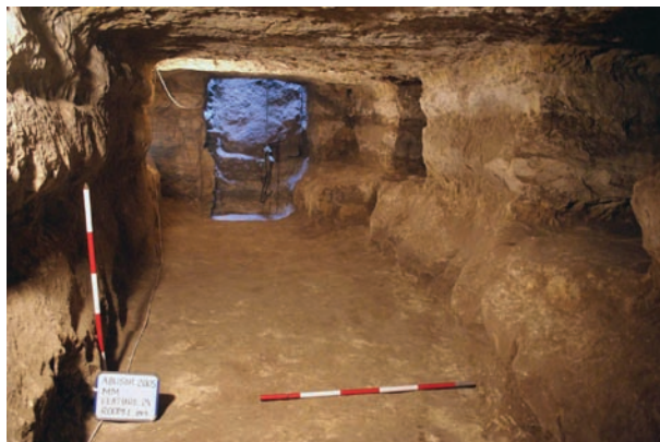
Obr. 3 Vstup do podzemí hrobky „MM“.

V době 3. dynastie, tj. přibližně v 26. stol. př. Kr., bylo obvyklé, že pohřební výbava hrobek vysoce postavených velmožů se skládala zejména z kamenných nádob. Ty také tvořily naprostou většinu nálezů, které je možno přiřadit k původnímu inventáři hrobky. Menší část kamenných nádob byla objevena v substruktuře mastaby, hlavní část ovšem pocházela z podzemí, a to jak ze záspy hlavní šachty (téměř 11 %), tak z podzemních prostor (přibližně 82 %). Většina se nacházela v kompaktní hlinité vrstvě, přibližně 0–50 cm nad podlahou chodby. Distribuce kamenných nádob