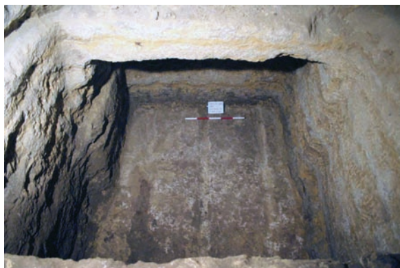
Obr. 4 Pohřební komora hrobky „MM“.

Pokud se týká typologie kamenných nádob, pak převažují otevřené tvary – různé typy misek a talířů (77 nádob). Uzavřené tvary jsou zastoupeny pouze šesti