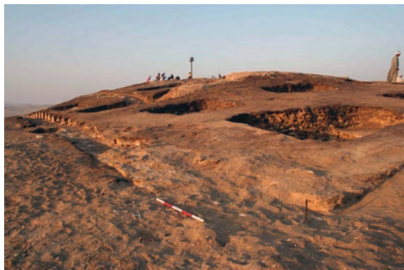
Obr. 1 Mastaba „MM“ z konce 3. dynastie, pohled od JV.

Přibližně ve středu mastaby se otevírá pravouhlý vstup do substrukтуры (tj. podzemní části), která se nachází 15 m pod současnou úrovní povrchu pouště. Vstupní prostor je 9,5 m dlouhý (v severojižním směru) a široký 1,45 m (na severu) a 2,7 m na jihu. Směrem k jihu vedou do podzemí celkem čtyři vysoké schody, které v hloubce 6,65 m pod současnou úrovní povrchu mastaby přecházejí v šachtu. Podzemí má velice neobvyklý půdorys v podobě písmene U, z něhož směrem na východ a západ vybíhá šest kratších chodeb, které původně sloužily jako skladiště. Vstup zatarasoval monolitický portkulis o rozměrech 3,9 x 1,4 × 0,3 m vytesaný z místního vápence. Chodba probíhající severojižním směrem měří 9,05 m (obr. 3), poté se lomí k západu