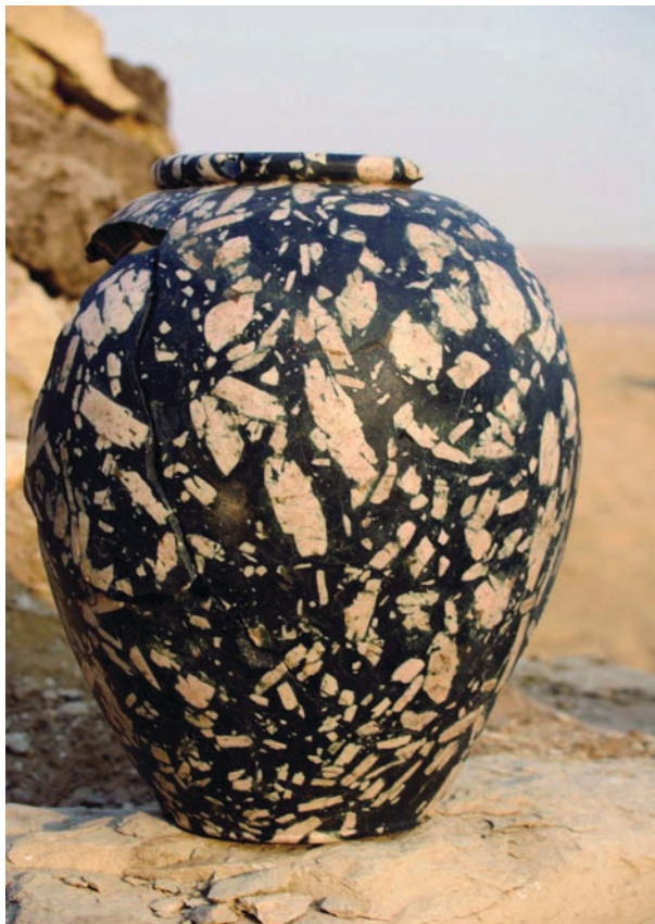
Obr. 5 Jedna z kamenných nádob z podzemí mastaby „MM“.