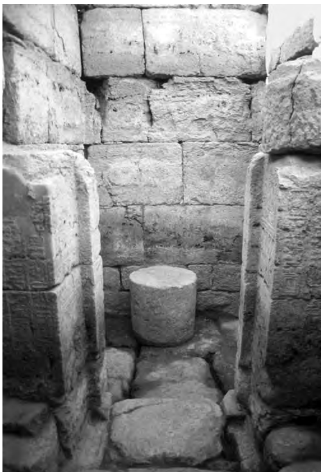
Obr. 6 Otevřený dvůr s oltářem v Esetině chrámu v Šanharu

ných rituálem „spojení se slunečním diskem“ ( hnm-itn ) či odhalení „neživých“ soch bohů paprskům slunce. Komplex sloužil ke klíčové fázi, někdy možná i jako poslední destinace, během slavnostních procesí, jež vedla k obnově soch uchovávaných v chrámu.