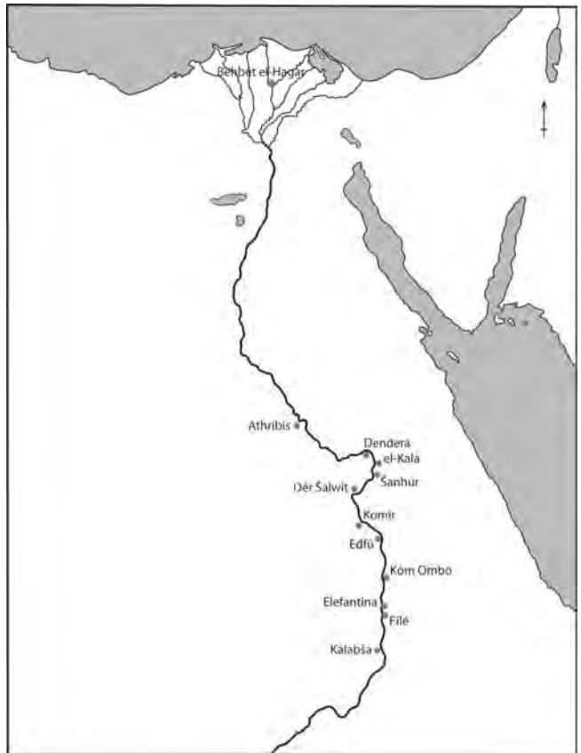
Obr. 3 Poloha komplexů wabetu a dvora (kresba L. Vařeková)