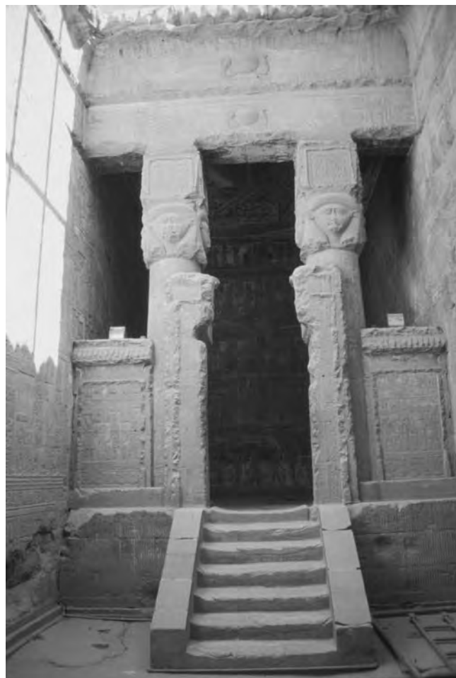
Obr. 2 Komplex wabetu a dvora v chrámu bohyně Hathor v Denderě

může být způsobena špatným stavem dochování chrámů na severu a jejich nedostačujícím publikováním spíše než nějakým účelovým geografickým plánováním staroegyptských kněží. Na druhou stranu známe také četné chrámy z Ptolemaiovské a Římské doby ve Fajjúmu a v západních oázách a žádný z lépe dochovaných chrámů v těchto lokalitách komplex wabetu a dvora neobsahuje, což by mohlo naznačovat, že se jednalo o typický architektonický komponent jen v hornoegyptských chrámech. Pouze další výzkum a archeologické vykopávky památek z tohoto období v deltě a středním Egyptě mohou nakonec vrhnout nové světlo na tuto problematiku.