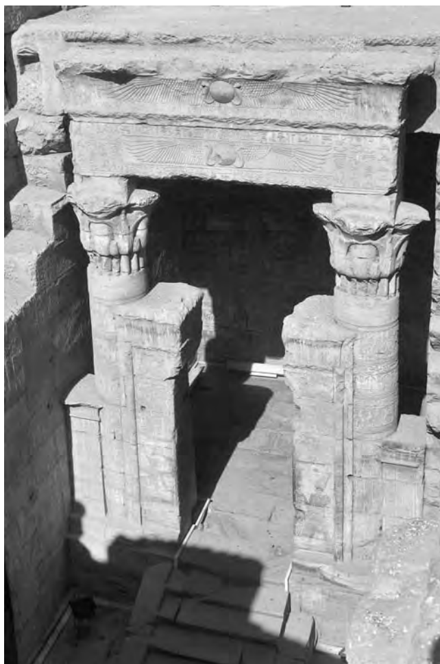
Obr. 5 Wabet v Horově chrámu v Edfú

Egyptští kněží, kteří vytvářeli nápisy a reliéfy na stěnách komplexů wabetu a dvora v ptolemaiovských a římských chrámech, používali k jejich označení celou řadu výrazů. Různé výrazy ilustrují různorodé aspekty komplexů jako jejich architektonickou podobu a také podobu a časové rozvržení rituálních aktivit, jež se v nich prováděly. Přestože komplex je dnes nejlépe znám pod označením wabet , nejčastěji užívaným výrazem – od počátku Ptolemaiovské doby až do prvního století římské vlády – byl s.t hb tpy „sídlo prvního svátku“. Toto označení jasně ukazuje, že komplex hrál významnou roli v průběhu prvního svátku ( hb tpy ), který se konal v posledních dnech starého roku a prvních dnech nového roku. Přechod mezi starým a novým rokem představoval v egyptském myšlení období obnovy a omlazení a tato idea byla inspirací pro řadu výrazů používaných k označení komplexu. Množství termínů se vztahuje k představám o smrti a pohřbu a následném vzkříšení a obnově života. Výraz w b .t („ wabet “) obecně označuje dílnu, kde se vyráběly všechny možné druhy zboží, avšak má také rituální konotace. Mohl popisovat místo balzamování, kde se připravovalo tělo zemřelého, či dokonce samotnou hrobku. Rovněž termín h 3 yt („ kaple “) poukazuje na tento aspekt komplexu coby dílny a hrobky. Přechodová oblast mezi naším a oním světem může být označována výrazem 3h.t („ horizont “), což bylo jedno ze jmen komplexu, zatímco jediný známý případ označení výrazem bw rnp („ místo regenerace “) by