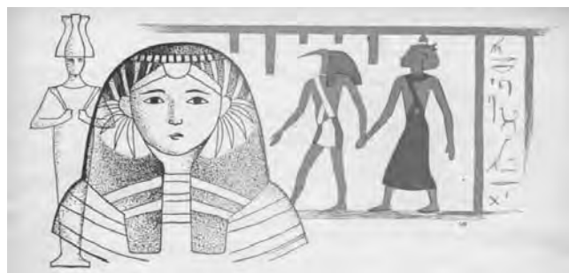
Obr. 5 Titulní strana pozvánky na výstavu v Brně (Dokumentační sbírka NM–NpM)

Výstava se svým atraktivním tématem, moderní instalací, zařazením do hromadného programu škol, o které se postaralo Ministerstvo školství, věd a umění, a také poměrně dobrou a rozsáhlou propagací v tisku i rozhlase (obr. 4), dočkala mimořádně velkého ohlasu u publika. 32 K němu jistě přispěla i zajímavá otvírací doba muzea, jež bylo v době konání výstavy otevřeno denně od 14 do 19 hodin a ve středu pak až do deváté hodiny večerní. V neděli mohli Pražané, ale i návštěvníci hlavního města zavítat do expozice od 10 do 17 hodin. 33