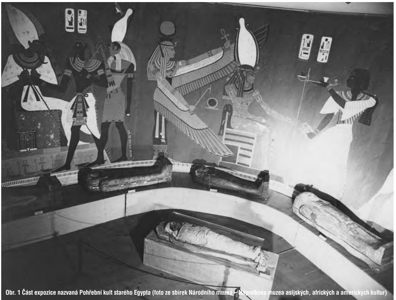
Obr. 1 Část expozice nazvaná Pohřební kult starého Egypta