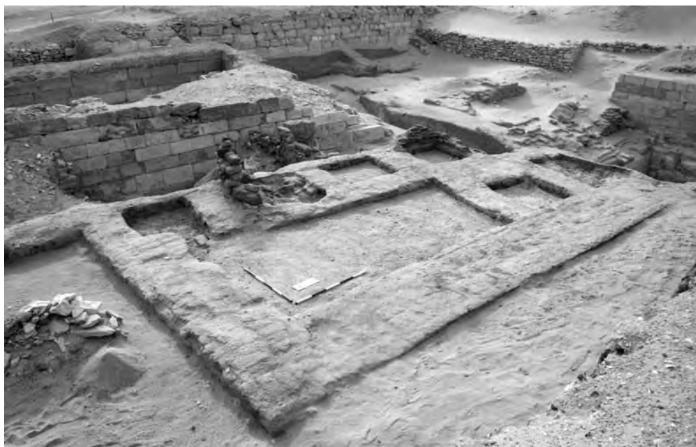
Obr. 1 Prostor výzkumu mastaby AS 38 na počátku prací v roce 2010 (od severozápadu). V levé horní části obrázku je viditelné kamenné zdivo mastaby kněze Inpunefera (AS 37), v pravé horní části se nacházejí anonymní hrobky označované jako AS 39–42

pouze 0,9 m, byla také postavena z nepálených cihel a byla ze všech stran omítnuta. Její východní průčelí obsahovalo střídavě jednoduché a složené niky. Přesné rozměry a plán hrobky jsme pod zdívem mastaby AS 38 nemohli zjistit a nezachytili jsme ani žádné stopy po pohřebních šachtách, které by k této struktuře jednoznačně patřily. Z výzkumu není zcela zřejmé, zda šlo o starší hrobku, kterou stavitelé mastaby AS 38 překryli v době, kdy zde již neprobíhal žádný kult. Je však více pravděpodobné, že tato nízká hrobka představuje úplně první fázi stavby mastaby AS 38, která vyrovnávala okraj