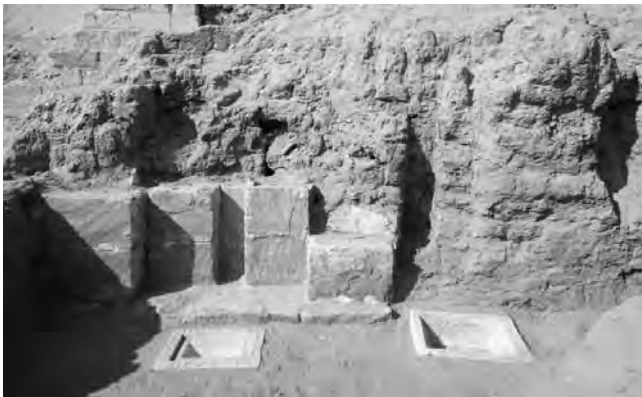
Obr. 3 Východní průčelí mastaby AS 38 stavitelé dodatečně ozdobili kamennou nikou, která doplňovala čtyři původní niky v cihlovém zdivu. Příjemným překvapením byl objev obětních bazének, jež dosud ležely v podlaže před nikami

byla později poničena při stavbě vnějšího kamenného pláště sousední Inpunerovy mastaby, takže dnes není možné stanovit původní rozlohu dvora, ani místo jeho vstupu.