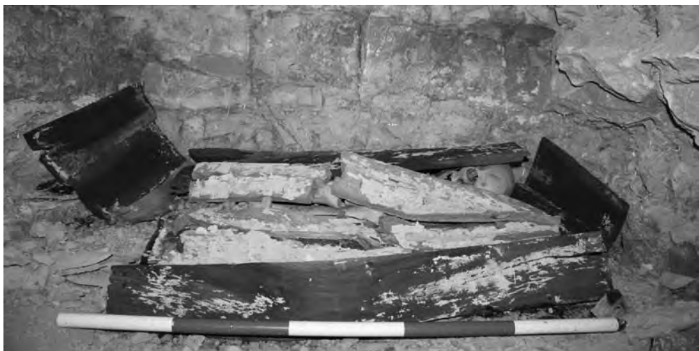
Obr. 5 Neporušený pohřeb v rakvi z cedrového dřeva nalezený v pohřební nise na dně šachty 3 patřil k nejlépe vybaveným pohřbům v této mastabě