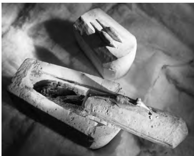
Obr. 4 Rakve skrývající mumifikovaná těla rejsků

Rejsci a myši pro svou spojitost se slunečním bohem patřili také k přísadám používaným pro výrobu magických přípravků. Podle návodného receptu K čemu se hodí rejsěk bylo možné využít srdce, žluč nebo i celý zbytek těla rejska v usušené podobě. Srdce mělo získat zájemci chválu, nápoj z rejsčího těla s krví zamilovaného měl přivodit touhu jeho vyvolené, ale požití žluče přivodilo smrt. Po vy-