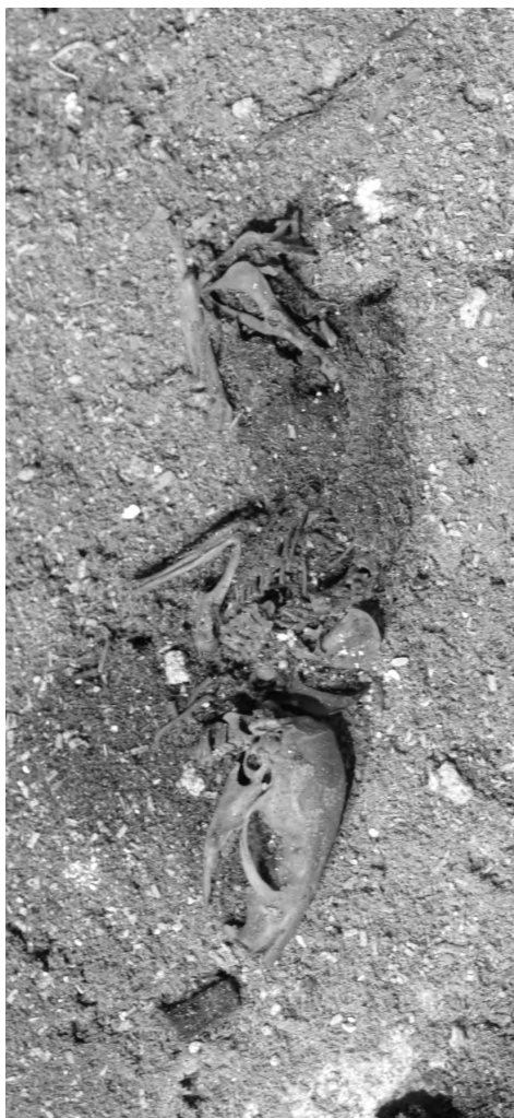
Obr. 3 Tělíčko myši bylo v sarkofágu pečlivě uloženo a překryto plátnem

čumáčkem myši na snímku, byl nejspíše jeden z korálků uvolněných z Inpunerofova náramku či z hole.)