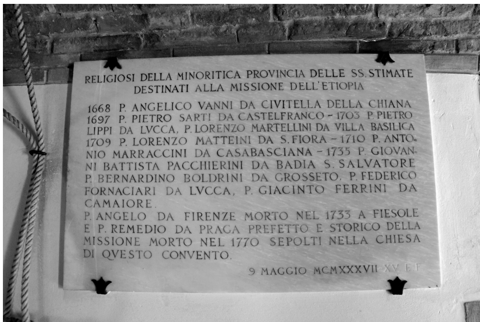
Obr. 4 Pamětní deska z konventního kostela ve Fiesole jmenuje i „o. Remedía z Prahy“