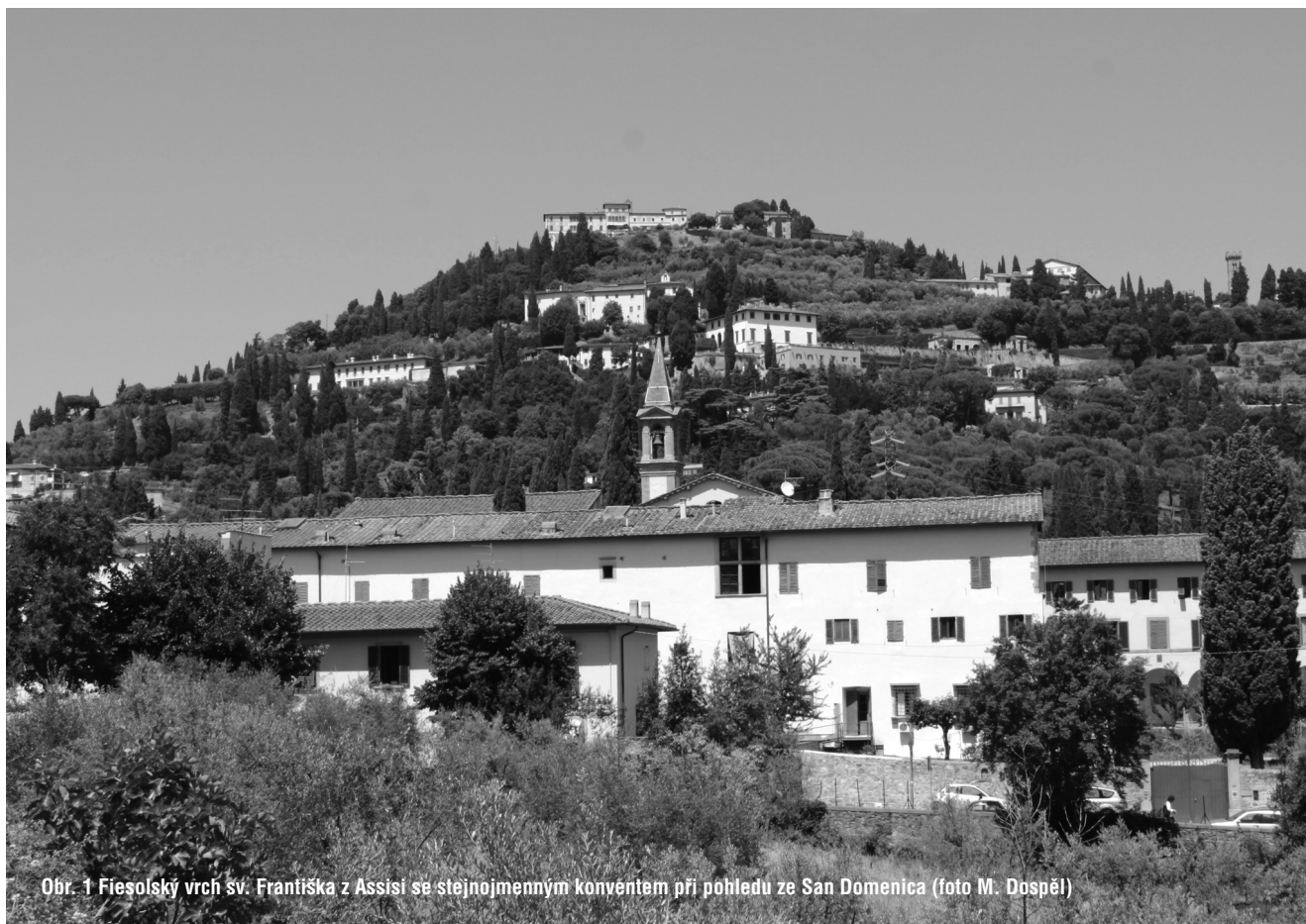
Obr. 1 Fiesolský vrch sv. Františka z Assisi se stejnojmenným konventem při pohledu ze San Domenico