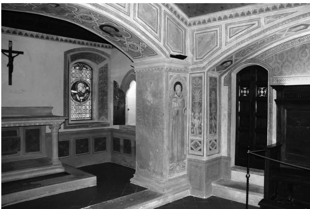
Obr. 3 Kaple pod presbytářem konventního kostela ve Fiesole s dveřmi vedoucími do pohřební krypty

Pozornost si dále zaslouží místo i délka pobytu ve Florencii. Už víme, že Prutký měl na cestu do Čech vyměřen čas do