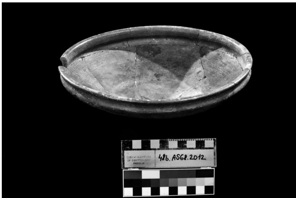
Obr. 4 Výsledok trpezlivej práce – kompletne zložená mejdúmska miska zo šachty 4

Na druhej strane pivné džbány a ďalšia hrubá úžitková keramika pre svoju nízku kvalitu a nedostatočný výpal nemohli „prežiť“ dlhé používanie, a môžeme preto predpokladať, že ich do hrobky uložili krátko po tom, čo boli vyrobené. Práve z tohto dôvodu sú pre nás oveľa spoľahlivejším datačným kritériom.