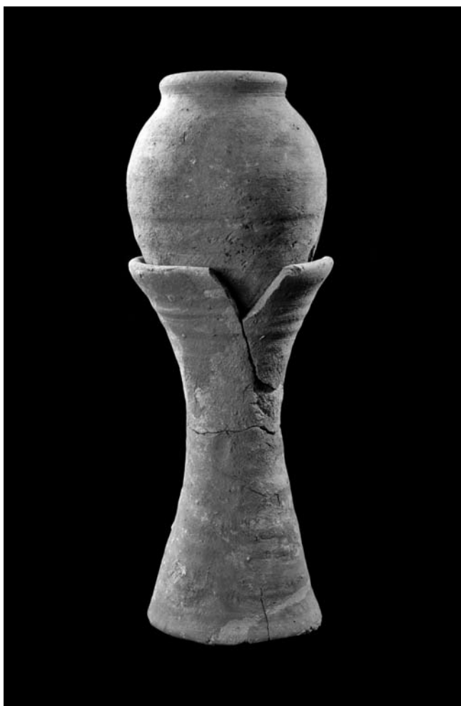
Obr. 7 Príklady vysokého stojana a malého džbánika z depozitu Neferhathor (foto M. Frouz)

Vo všetkých prípadoch šachtových depozitov je charakteristické, že veľký podiel nádob tvoria stojany a podnosy – dve hlavné rituálne keramické triedy, ktoré sa používali spoločne. V prípade Neferovej manželky bolo identifikovaných minimálne 37 stojanov a 12 podnosov. Všetky stojany boli vyrobené z pomerne jemného nílskeho ílu B1 a niektoré sú i listrované. Najkvalitnejší, aj keď len čiastočne dochovaný je príklad mohutného stojana v tvare písmena A (s rovnými, smerom dolu sa rozširujúcimi stenami), ktorý je zdobený trojuholníkovými „oknami“ (analógie pozri napr. Reisner – Smith 1955: fig. 129, č. 36-3-43 a 34-12-3). V kontexte sa nachádzali minimálne dva doklady, pričom oba boli pokryté kvalitným hustým listrom a po vypálení vyleštené. Oveľa častejší je však typ vysokého stojana v tvare písmena X alebo presýpacích hodín (obr. 7). V tomto kontexte je doložená variácia s jednoduchými i modelovanými okrajmi. Veľkostne sú tieto stojany pomerne homogénne, napríklad pri všetkých kompletných príkladoch stojanov typu s jednoduchým okrajom (ktorých je 6) má okraj priemer 12–13,5 cm. Posledným doloženým typom je nízky stojan s konkávnymi stenami. Používanie tohto typu sa zdá byť vymedzené koncom 5. dynastie.