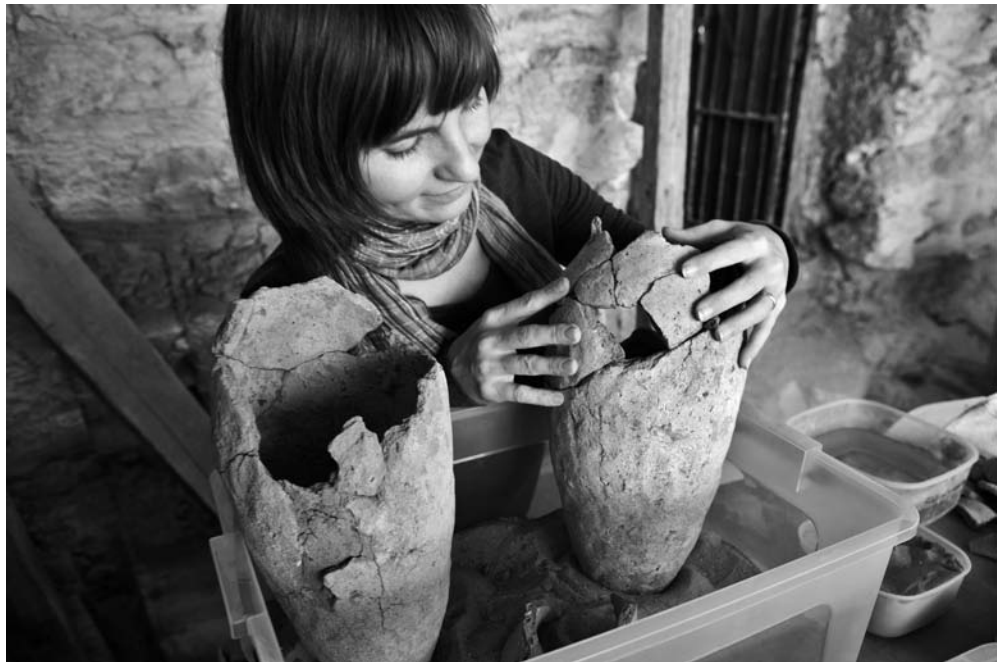
Obr. 2 Skladanie pivných džbánov s cieľom získania kompletného profilu nádob, významného pre ich datovanie (foto M. Frouz)