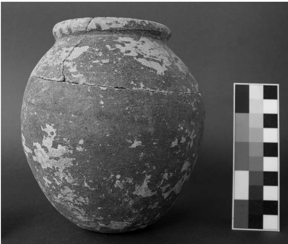
Obr. 3 Malý džbánik zo šachty 1 umiestnenej v severozápadnom rohu dvora princeznej