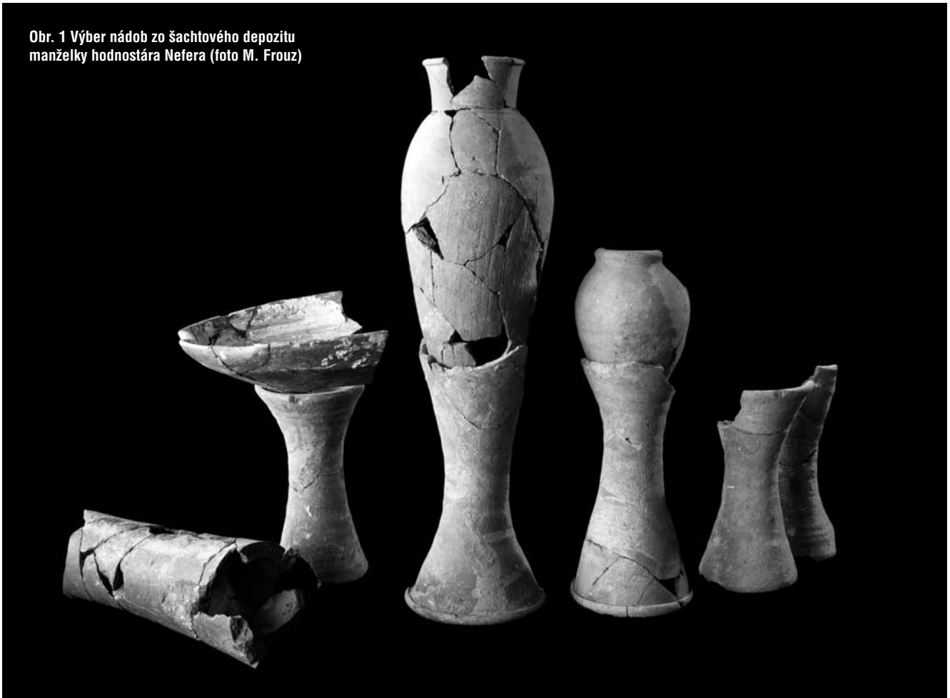
Obr. 1 Výber nádob zo šachtového depozitu manželky hodnostára Nefera