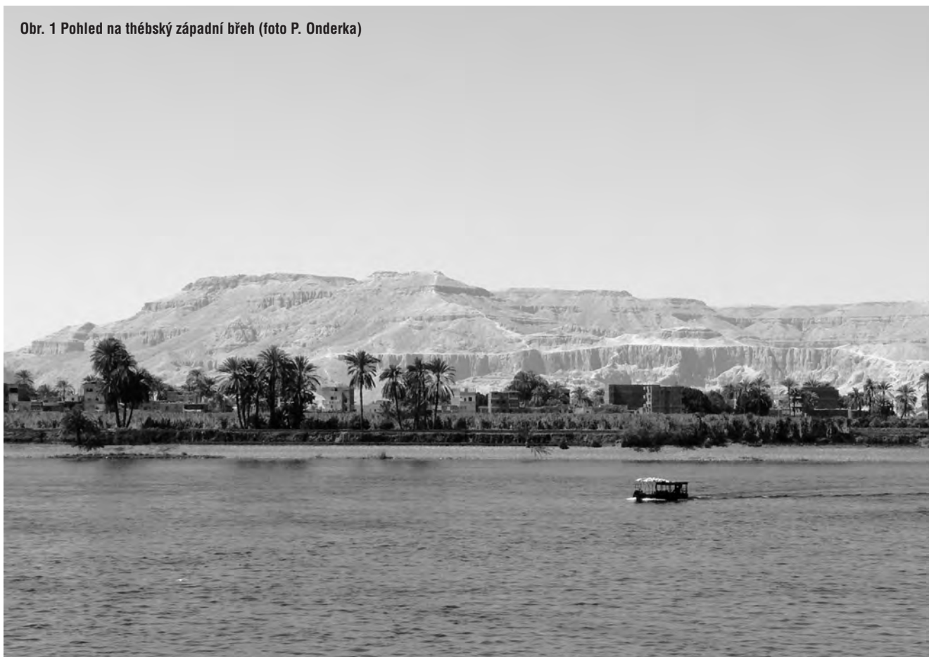
Obr. 1 Pohled na thébský západní břeh