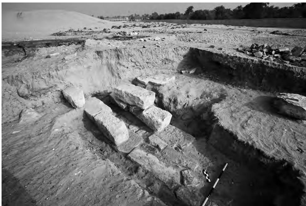
Obr. 3 Jihozápadní zeď kamenné stavby AS 73. Pohled od jihu

piny dosahovaly tloušťky kolem 1,5 m, ostatní zdi měly tloušťku kolem 1 m. Hloubka základů položených do čistého písku sahala v průměru 0,6 m pod tehdejší povrch, který byl určen podle úrovně povrchu základového zdiva i podle přilehlé stratigrafie. Parametry zdiva dovolují předpokládat, že všechny tři stavby měly nejméně jedno nadzemní podlaží nebo nesly staticky exponovanou střechu. Podlahy, pokud se je podařilo zjistit, byly tvořeny prostým násypem z písku promíšeného s hlínou, na povrchu silně ztvrdlého a prosoleného. Pod podlahou se nacházela vyrovnávací a zpevňující vrstva vápencových úštěpů, z nichž některé nesly zlomky reliéfů ze Staré říše. Podle stratigrafických pozorování byla vyrovnávací vrstva uložena teprve po vybudování cihlových staveb. Nálezy z této vrstvy proto představují důležitý pramen datování vzniku AS 70.