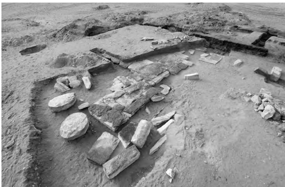
Obr. 4 Torzo dlážděného dvora AS 73. Vlevo zbytky sloupů v druhotné poloze. Pohled od jihovýchodu

Konečná interpretace komplexu, který se skládá z kamenné stavby, dvora a na obvodu rozmístěných cihlových