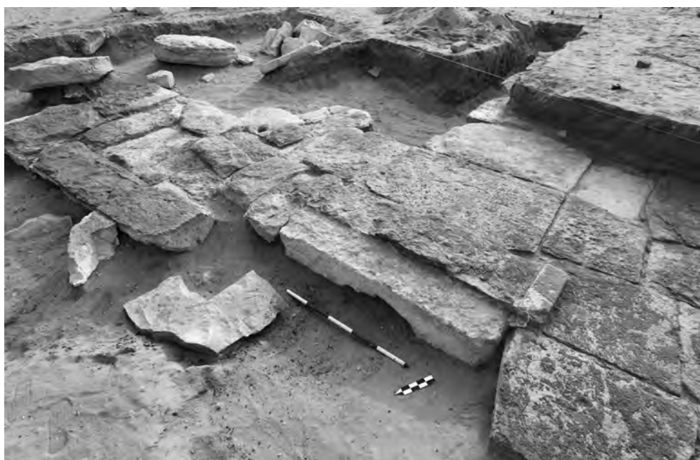
Obr. 5 Schod nebo práh ve středu dlážděného dvora AS 73. Pohled od jihu

budov, bude možná až po dokončení výzkumu. Již nyní lze říci, že s největší pravděpodobností není pozůstatkem sepulkrální stavby. Proti tomu ostatně svědčí samotná orientace a dispozice komplexu. Velmi důležité jsou nálezy četných zlomků vápencových reliéfů a malovaných vápencových stěn, které se nacházely v písčitém souvrství pokrývajícím kamennou stavbu a dvůr AS 73. Tyto zlomky pocházejí podle podrobných stratigrafických pozorování zcela jistě z ústřední kamenné stavby, z níž byly při jejím rozebírání na místě odtesávány. Jejich analýza, poněkud ztížená jejich značnou torzovitostí, není ještě ukončena. Dosavadní pozorování však naznačují, že pravděpodobně vytvářely výzdobný program nějakého menšího chrámu, popřípadě paláce, který byl vybudován v období Nové říše. Zjištěná dispozice komplexu tuto hypotézu rozhodně nevylučuje. Datování je ověřeno nálezy rozbitých zásobních nádob a amfor, mnohdy s modrým malováním, pocházejících z 18. dynastie a doby pozdější. Na zlomcích dvou amfor se nacházejí hieratické nápisy, zatím nerozluštěné, a na oušku amfory otisk kartuše se jménem Mn-Phtj-R c (Ramesse I.).