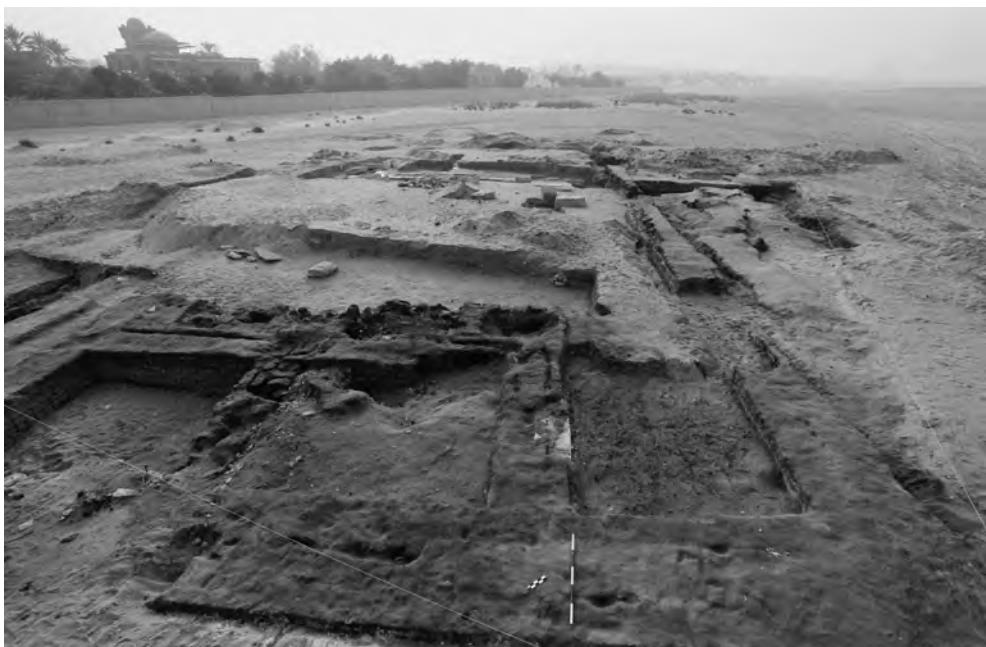
Obr. 2b Vlevo cihlová budova o dvou místnostech na severozápadní straně komplexu. V popředí vápencový práh, od něj dále pravděpodobně sýpka. Vpravo ubíhá vnitřní zeď dlouhé budovy. Pohled od severozápadu

Skupina staveb AS 70 vznikla evidentně v jedné stavební fázi. Byla vystavěna z tmavě šedých sušených cihel o rozměrech 32 × 15 × 10 cm. Zdi na vnějším obvodu sku-