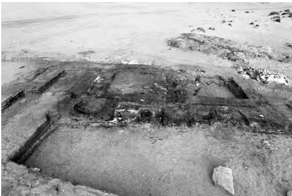
Obr. 2a Cihlová budova o dvou místnostech na severozápadní straně komplexu. Před budovou vlevo pravděpodobně sýpka. Pohled od jihovýchodu

Nález byl učiněn na ploše poničené recentními zlodějskými výkopy v nejnižší (východní) partii české koncese, několik set metrů na sever od zaniklého Abúsírského rybníku, na rozhraní mezi osídleným nilským údolím a starověkou nekropolí. Při záchranném archeologickém výzkumu byl během 22 dnů odkryt terén v rozsahu asi 500 m 2 do hloubky 0,2–2 m. Nad skupinou cihlových mastab s nikovaným průčelím, které pocházejí ze (spíše starší fáze) Staré říše, byla odkryta část rozsáhlého stavebního komplexu (obr. 1). Nacházel se na půdorysu obdélníku o šířce 31 m a délce více než 47 m, jehož podélná osa je orientována ve směru severozápad–jihovýchod.