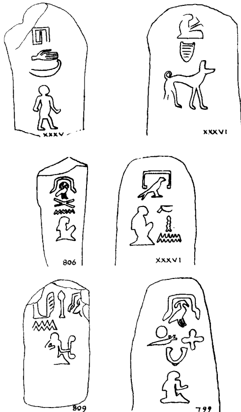
Obr. 3 Stély zachycující jméno a případně tituly majitelů vedlejších hrobů v Abydu (podle Petrie 1900: pl. 32). Nachází se mezi nimi jeden z trpaslíků a jeden z královských psů

pohřebiště se zdá, že některé hroby sloužily pouze jako skladištní komory. V tomto kontextu je možné chápat okolní skutečné hroby jako přibytky těch, kteří měli s daným materiálem co do činění.