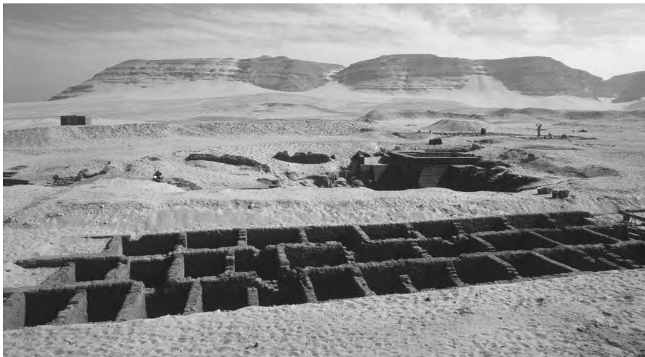
Obr. 1 Pohled na řadu očištěných vedlejších hrobů náležejících k hrobce panovníka Džera