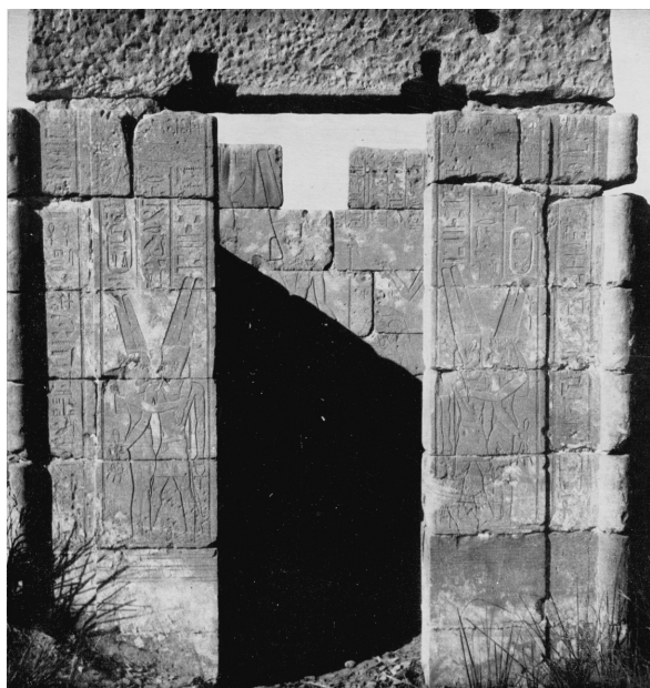
Obr. 2 Karnak - svätynja Usira-Onufrida. Božská manželka Amona Amenardis II. a Šepenušet II. objímajú Amona. Podľa Leclant (1965: Pl.XVIII).

Božská manželka – hmt ntr stála na čele veľkého dvora, ktorý bol označovaný ako „doména božskej zbožňovateľky“, a zamestnávala početný personál vrátane „speváčok vnútorných [konnát] Amona“, ktoré boli, ako ich veliteľka, nútené žiť v celibáte a pochádzali z vysokých vrstiev spoločnosti, ďalej sem patrilo množstvo hodnostárov, kňazov, pisárov a samozrejme umelcov: jmj-hnt , mr zšw , sdm ʕš (n Imn) , šmst ʕt , ak máme spomenúť iba niektoré funkcie; ich predstaveným bol vrchný správca domény božskej manželky Amona – mr pr wr n Dwʕt-ntr nt Imn . Títo správcovia (Ibi, Pabasa, Achamenru) boli neobyčajne mocní a rovnako tak vplyvní, aby zohrali dôležitú úlohu pri mierovom znovuzачlenení juhu do zjednoteného Egypta na začiatku 26. dynastie. Neprehliadnuteľná je ale úloha Menthemheta – 4. proroka Amona a starostu Théb, ktorého vplyv siahala od Elefantíny na juhu, až po Hermopolis na severe. Ako prakticky