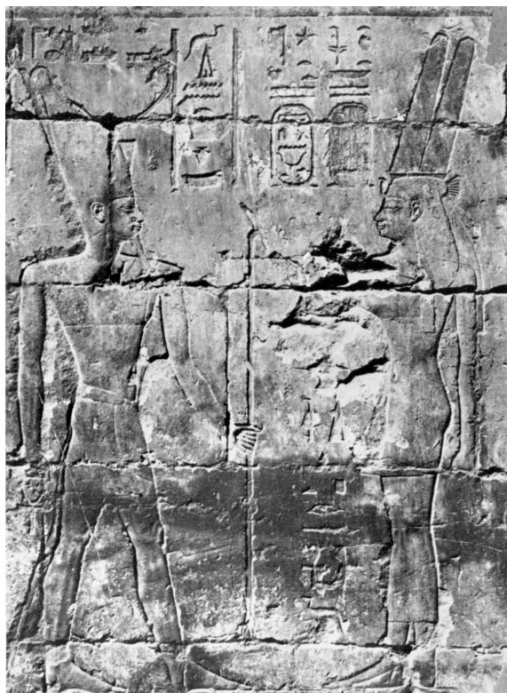
Obr 6 Medinet Habu-svätyňa Amenardis I. Šepenuzet pred bohom Atumom. Podľa Leclant (1965: Pl.LXXXIV).

dcéry vo svojej službe bohu označované za božské manželky, ruky boha, alebo jeho zbožňovateľky, prísľub celoživotného celibátu nesmeli porušiť.