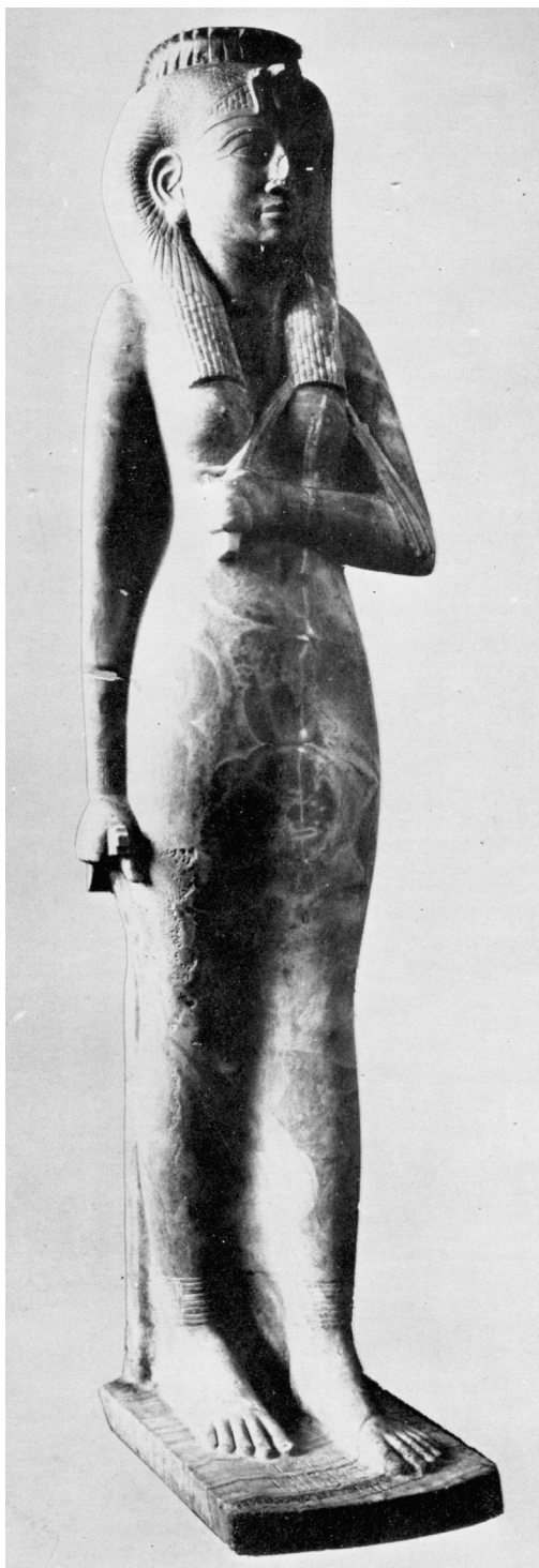
Obr. 4 Alabastrová soška Amenardis I. Káhira C.G. 565. Podľa Leclant (1965: Pl. LXI).