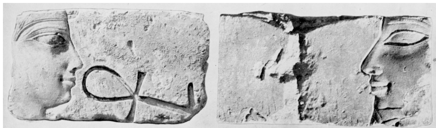
Obr. 3 Karnak-sever. Božská manželka Amenardis a boh Amon – rekonštrukcia. Podľa Leclant (1965: Pl.LVID).