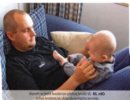
Obr 13. Hozník dokáže pozorovat i hračku, kterou maminka pohybuje na stole, když se pohodlně uvelebí na jejím klíně.