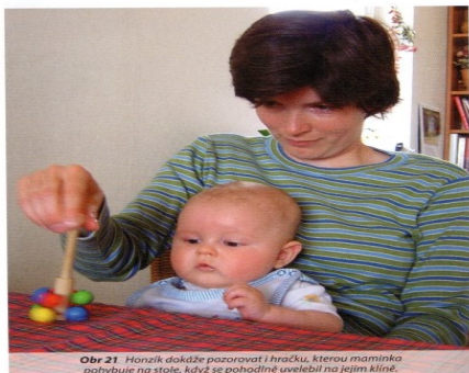
Obr 21. Hozník dokáže pozorovat i hračku, kterou maminka pohybuje na stole, když se pohodlně uvelebí na jejím klíně.

podobně postupně, postupně, tak postupně postupně a postupně postupně takže se zádičky plně opírá o naši hruď. Jeho páteř tak není zatěžována