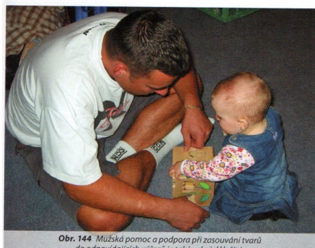
Obr. 144. Mužská pomoc a podpora při zasouvání tvarů do obojvzájemných vířezů je trnkou velmi dítěte.